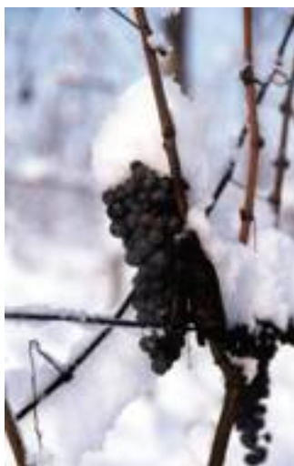
>> La raccolta è tardiva, a ottobre inoltrato, e spesso sotto la neve.

La vendemmia non avviene prima della fine di ottobre, circa 20 giorni dopo la Barbera; la resa è di circa 80q/ha. La raccolta è fatta a mano e i grappoli