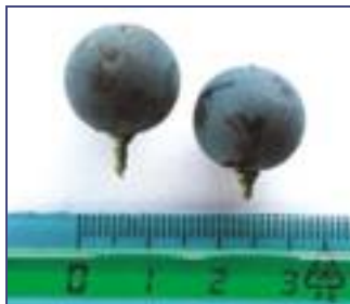
>> Acini piccoli e medio piccoli, di colore blu, del vitigno autoctono.

L'Uvalino soffre la grandine; possiede una migliore tolleranza verso la peronospora rispetto alla Barbera, ma è più sensibile all'oidio. In cinque anni di osservazione si è sempre ripetuta la ricchezza di resveratrolo, tanto che si ipotizza che la sua spiccata tolleranza verso la botrite sia proprio legata alla presenza così importante di questo composto che dall'uva passa successivamente al vino, conferendogli un notevole potere antiossidante.