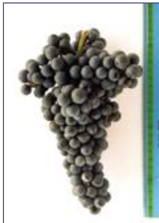
>> Il grappolo è compatto, di forma tronco-conica dotato di ali.

vengono sistemati in cassette forate dove vengono fatti ulteriormente appassire in un locale ventilato e a temperatura controllata per circa un mese.