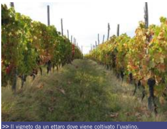
>> Il vigneto da un ettaro dove viene coltivato l'Uvalino.